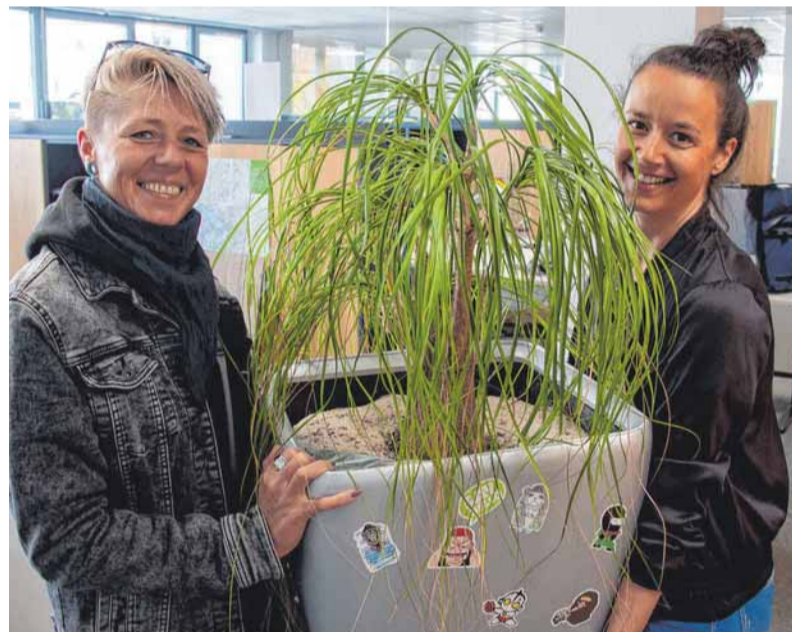
Für den Elefantenfuß „Slavko“, der jahrelang in der Redaktion in der Schanzstraße stand, wurde vor dem Umzug ein neues Zuhause gefunden. Wie es ihm wohl mittlerweile geht?