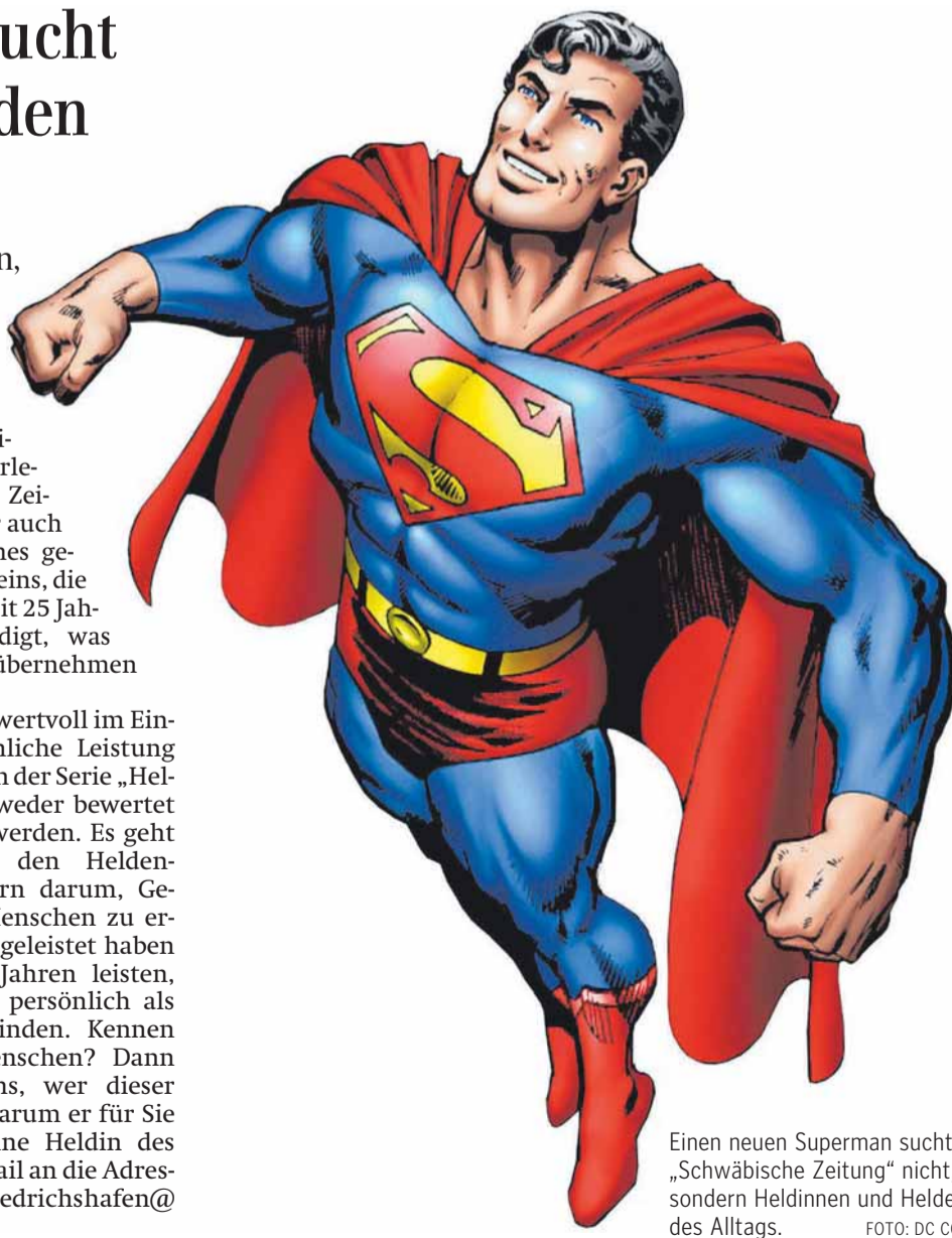
Einen neuen Superman sucht die „Schwäbische Zeitung“ nicht, sondern Heldinnen und Helden des Alltags.

Verändert hat sich übrigens auch der frühere Ort unseres Wirkens in der Schanzstraße. Dort hat inzwischen das Hotel „City Krone“ erweitert – und einen großen Spa-Bereich errichtet, in dem es sich auch Nicht-Hotelgäste gutgehen lassen können.