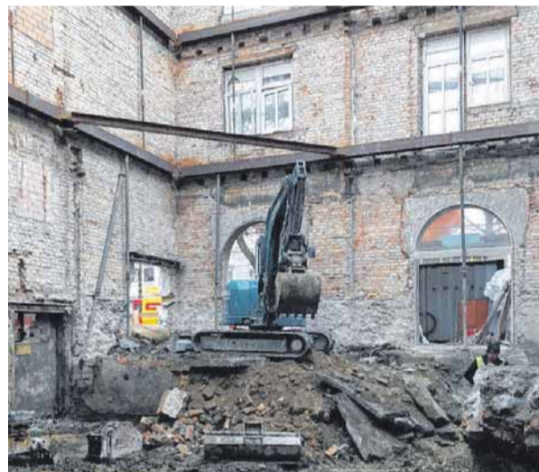
Die entkernte Apotheke während des Umbaus: Nur Fassade und Dachaufbauten bleiben erhalten.

Erste Planunterlagen stammen aus dem Jahr 1903. Anfangs war es noch als reines Wohngebäude konzipiert. Dort leb-