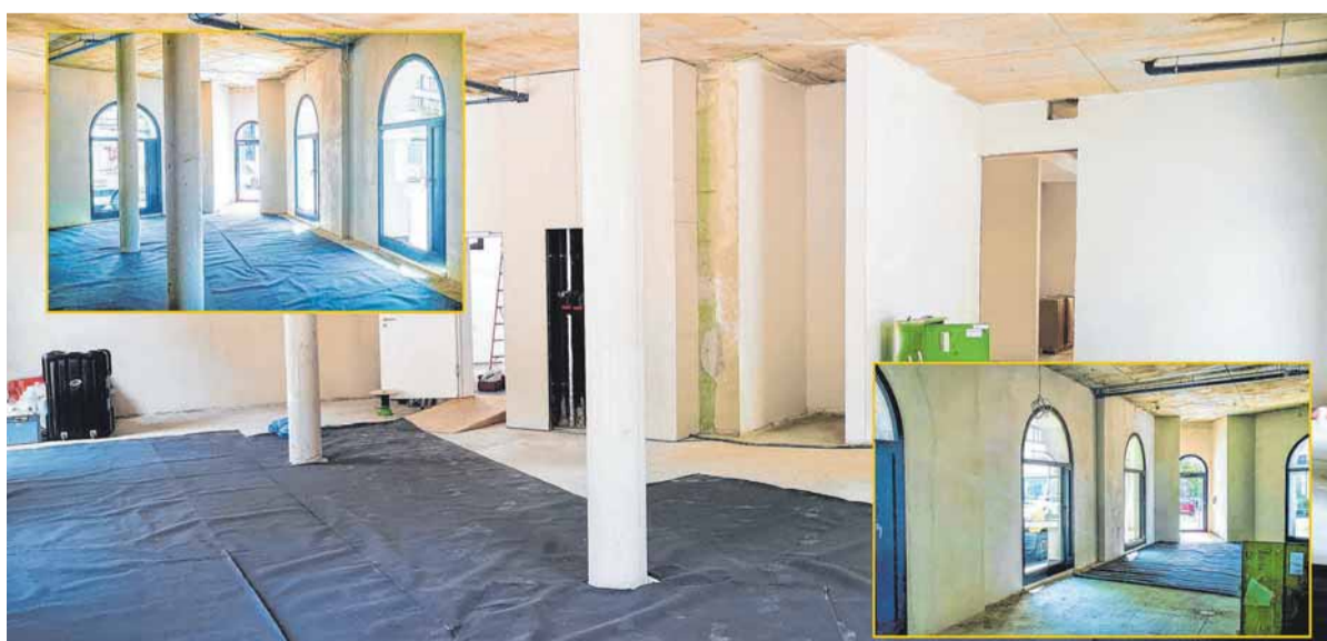
Im Erdgeschoss, dem früheren Apothekenbereich, wartet eine großzügige Fläche samt zweitem Raum (hinten rechts). Die kleinen Bilder zeigen den jeweiligen Blick zur Fensterfront, das große Bild den Raum von der Eingangstüre aus. Hier bietet es sich geradezu an, eine Bar oder ein Café einzurichten.