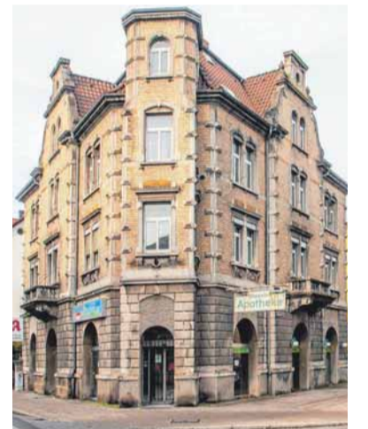
„Hier wurden Werte erhalten“: So sah die alte Zeppelin-Apothek aus, bevor Prisma mit dem Um- und Ausbau begonnen hat.

Kompetenzfelder der österreichischen Prisma-Unternehmensgruppe liegen in der aktiven Gestaltung von Dorf-, Quartiers- und Stadtentwicklungsprojekten sowie der Entwicklung, Umsetzung und langfristigen Führung von Impulsstandorten für Innovation, Technologie und Kreativität, heißt es in der Pressemitteilung. Ihren Friedrichshafener Sitz hat Prisma im Competence-Park im Gewerbegebiet am Flughafen.