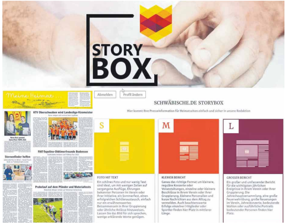
Einfach zu bedienen: die „Schwäbische Storybox“.

Dabei gilt das Versprechen, dass das neue Programm auch für solche Menschen einfach zu bedienen ist, die wenig Erfahrung mit dem Internet haben. Das be-