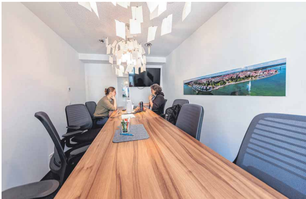
Großzügig: der neue Konferenzraum in der Eugenstraße 75.

Die zehn Mitarbeiter im Marketing und in der Anzeigenabteilung betreuen langjährige Kunden, gewinnen neue hinzu und beraten, wie Unternehmen die „Schwäbische Zeitung“ und viele andere Produkte des Hauses – gedruckt oder digital – als Werbepattform nutzen können. Wichtig: Auch wenn Redaktion und Verlag auf dem gleichen Stockwerk zusammensitzen, sind die Inhalte voneinander getrennt. Die Resultate, die künftig in der Eugenstraße 75 entstehen, gibt es in der gedruckten Zeitung, im E-Paper oder auf Schwäbische.de zu sehen. Online werden die Artikel nach Möglichkeit mit Videos, Grafiken, Karten oder Bildergalerien angereichert.