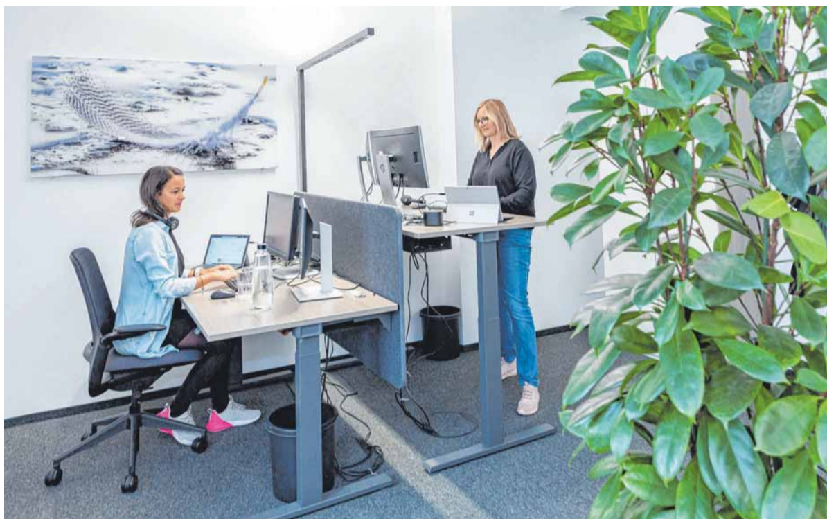
Sitzen oder stehen: Wer bei der Schwäbischen Zeitung in Friedrichshafen arbeitet, kann am Schreibtisch beides tun – der nagelneuen Büroausstattung sei Dank.